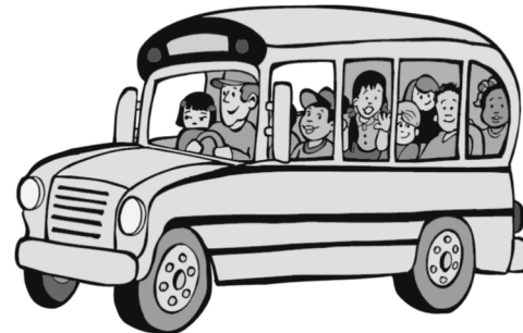
El autobús está lleno.