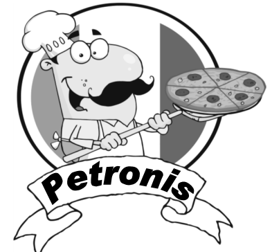
Hoy voy a ir a Petronis.