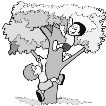
Los primos son traviosos.