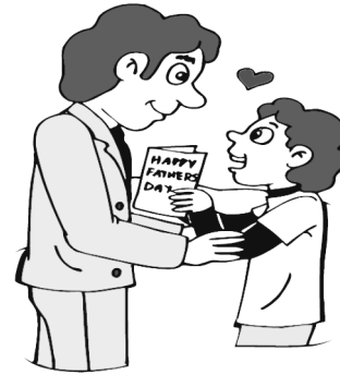
Día del Padre.