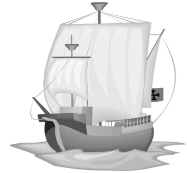
El barco navega mañana.